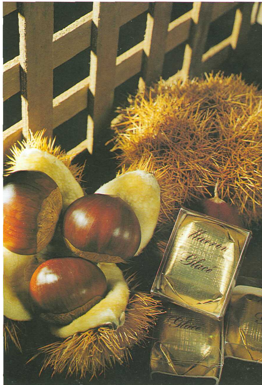
La castaña permite la incorporación de valor agregado, ya que se comercializa con distintos tipos de procesos: marrón glacé, pastas, al jugo, etc.

Una de las limitantes importantes, a la hora de pensar en la exportación, es la desuniformidad de la producción.