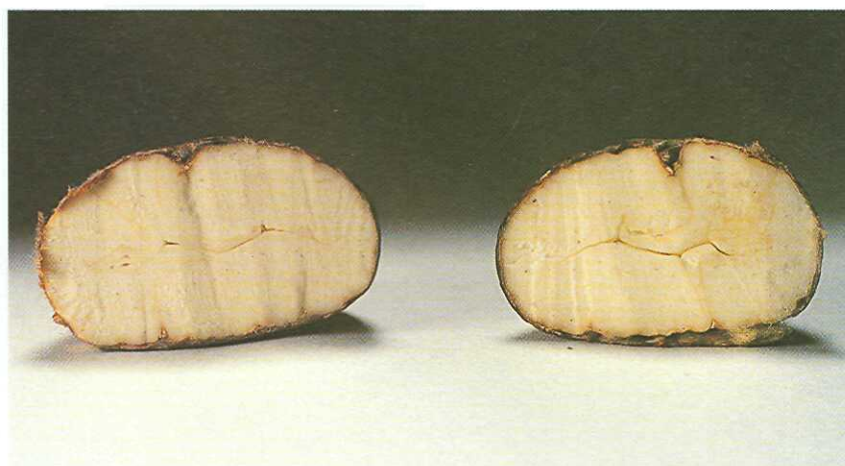
Castaña tipo marrón. Colectada en el país, se caracteriza por poseer un solo embrión y piel fácilmente desprendible.

Japón: es el principal importador. Satisface su demanda desde China, que abastece cerca del 90 por ciento del total de sus importaciones. Otros proveedores son Corea del Sur, Italia, Corea del Norte y Francia. El precio alcanzado por las castañas en el mercado japonés en los últimos años ha fluctuado entre 2,75 y 2,96 dólares por kilo.